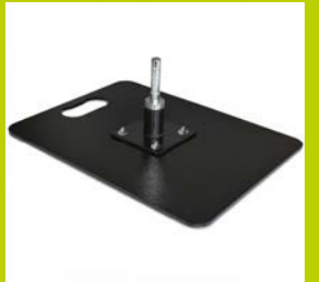
BODENPLATTE 6 / 15 / 20 kg