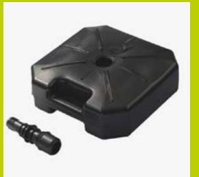
STANDFUSS WASSERTANK, ca. 16 kg