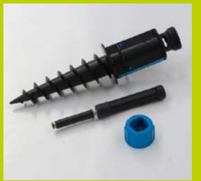
ERDSPIESS KUNSTSTOFF für Sand und lockere Böden