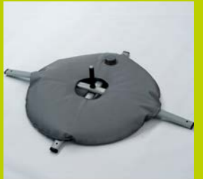
BODENKREUZ MIT WASSERSACK