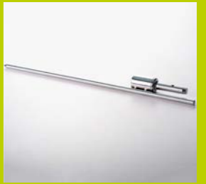
ERDSPIESS METALL für Erde und harte Böden